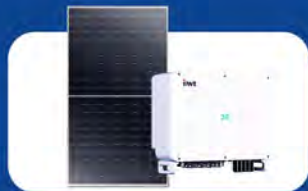
SOLAR PANEL & INVERTER