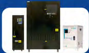
SERVO MOTOR STABILIZER