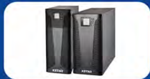
LOW CAPACITY UPS