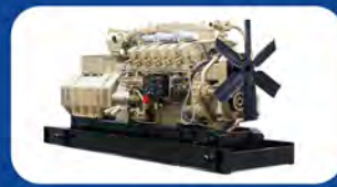
GENERATOR DIESEL & GAS