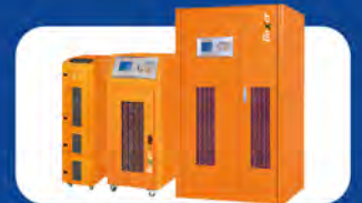
HIGH CAPACITY 3 PHASE