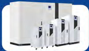
TRANS BASE UPS