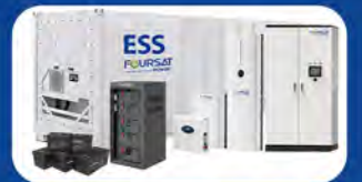
BATTERY & ESS

دفتر مرکزی : تهران ، خیابان ملاصدرا ، پلاک ۱۰۷ ، طبقه ۴ ، واحد ۶۲